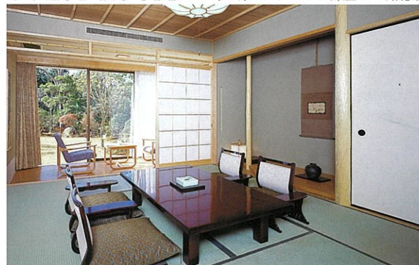
和室一例 落ち着いた雰囲気が心地よさを演出します。