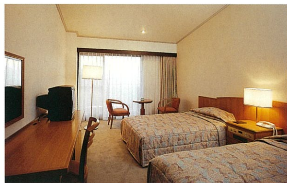
洋室一例 モダンでスタイリッシュな寛ぎの佇まい。