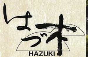
源泉かけ流しと 本格漢方薬膳料理