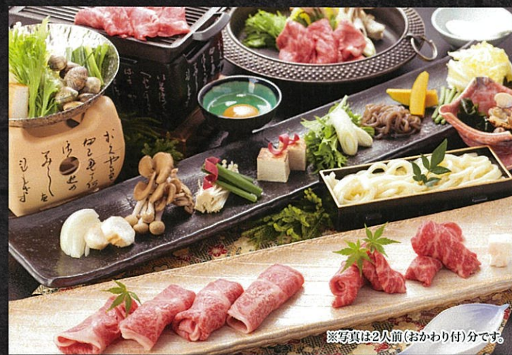
※写真は2人前(おかわり付)分です。