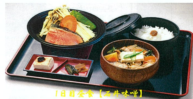
1日目昼食【石井味噌】