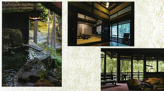
世界遺産にも登録された合掌造りの建物が、料理人、サービススタッフも揃った皆様の別荘となります。