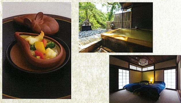
本格漢方薬膳料理と源泉かけ流しの名湯。美容と健康が約束された贅沢な一夜です。