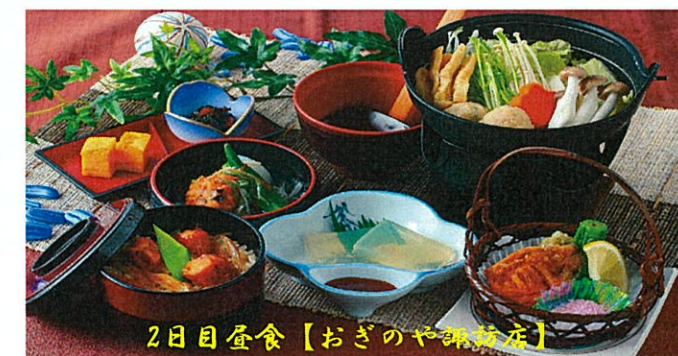
2日目昼食【おぎのや諏訪店】