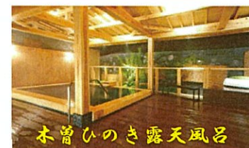
木曾ひのき露天風呂