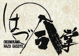
築200年の合掌造りの建物

旅館を丸ごと一棟貸切る。 人生で一度は体験してみたいこんな究極の贅沢をはづグループでは、大変お得な料金でご用意いたしました。 ご家族、ご友人、趣味のお集まり、企業研修……。特別な一夜を特別な方々とお過ごしくだけませ。