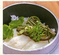
若狭ふぐの釜めし