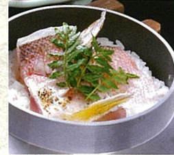
若狭ぐじの釜めし