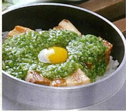
豚の角煮の釜めし