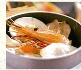
若狭の海鮮釜めし