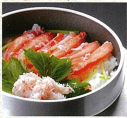
ズワイガニの釜めし