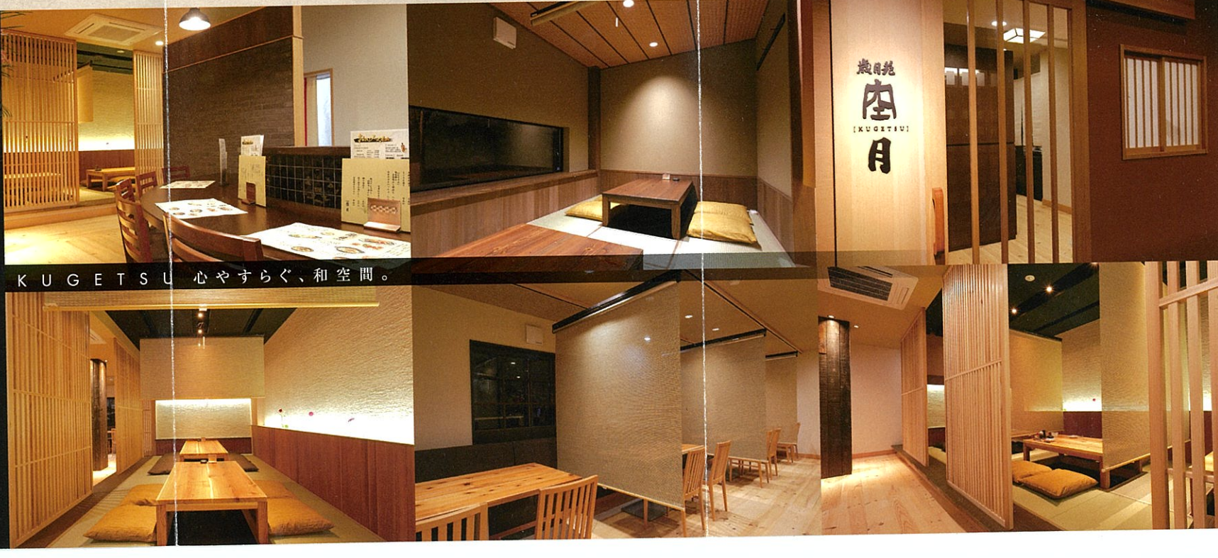
KUGETSU 心やすらぐ、和空間。