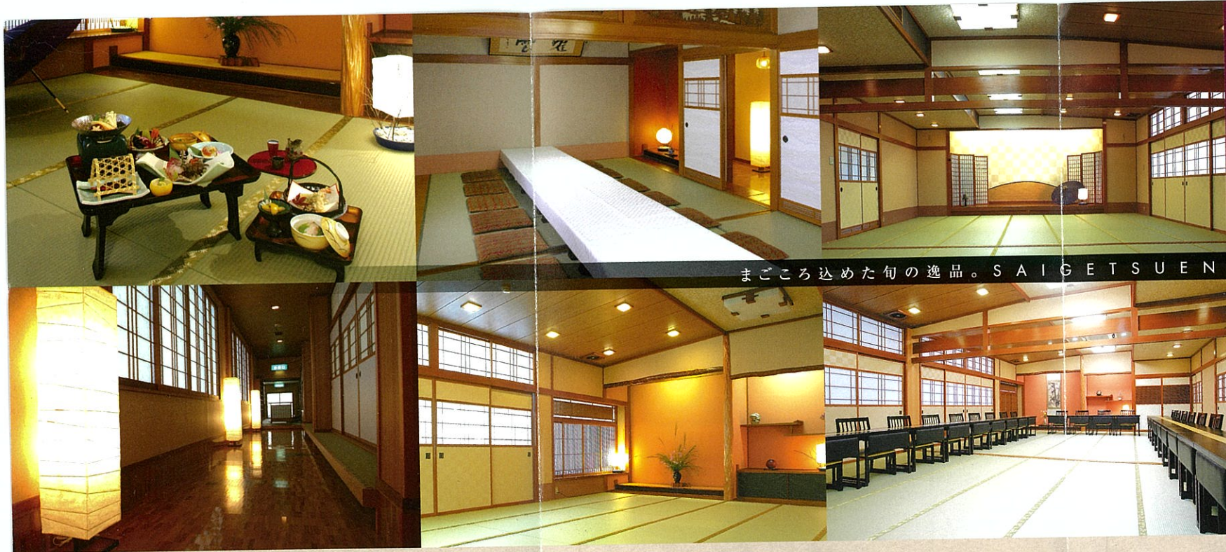
まごころ込めた旬の逸品。SAIGETSUEN