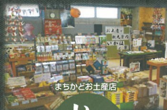
まちかどお土産店

本格石窯料理&ピザ・パスタ等の洋食レストラン。 当店オリジナル料理など、種類豊富な お酒とともに楽しみ頂けます。