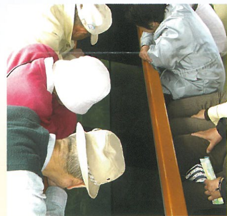
▲ グラスボート(海中透視船)の様子変化に富んだ海中景観に見入る観光客