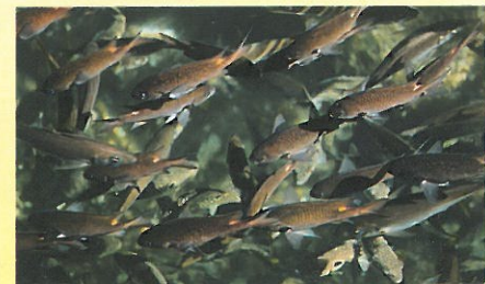
▼ 発着場の海中は餌付けされた魚が多く見られます