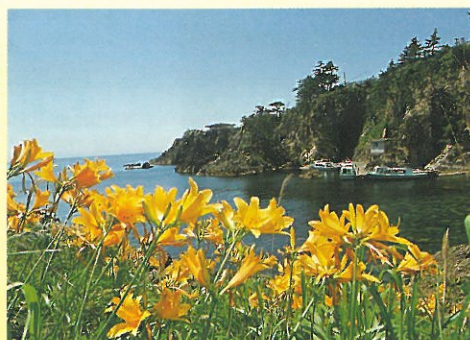
▼ グラスボート乗り場とカンゾウの花(5月下旬~6月上旬)