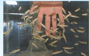
▲ ドクターフィッシュ 人間の古くなった角質を食べる習性があり、皮膚病の治療効果があるとされています。