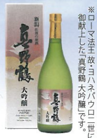
※ローマ法王故ヨハネパウロ二世に御献上した真野鶴大吟醸です。

真野鶴はその首都的な役割も担い、1987年にはバチカンのローマ法王、故・ヨハネ・パウロ二世に謁見を果たし、当社の大吟醸を献上してまいりました。真野鶴は国内外の鑑評会でも高い評価を頂いています。