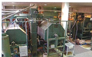
2階/仕上げ総合工程(再製工場)