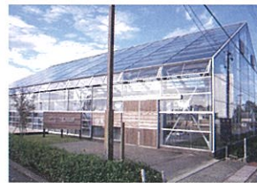
▲THE HOUSE 外観

茶畑が一望できる全天候型ウッドテラス・休憩スペース「THE HOUSE」。茶畑の中でゆったりとした時間を過ごして下さい。