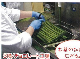
3階/チョコレート工場