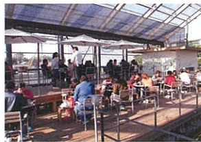
▲THE HOUSE 内部の様子