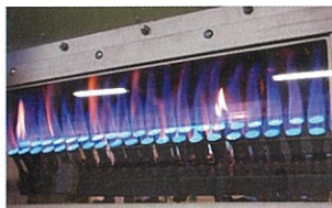
1階/ほうじ茶製造工場

1階は焙じたお茶の香り漂う「ほうじ茶工場」、2階は牧之原の歴史を知る「牧之原歴史室」とお茶の仕上げをする「再製工場」、そして3階では「チョコレート工場」やお茶の保管をする「立体自動冷倉庫」を専用通路よりご覧いただけます。お茶を製造をする「荒茶工場」は、2階と3階にあるミニ製茶機械を参照ください。出来上がったお茶は、直売店「逸品館」にも並んでいます。