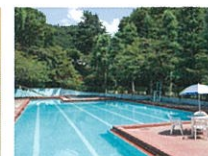
プール(夏期のみ営業)