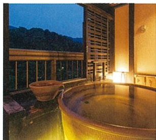
露天風呂付客室一例

郷土の味覚を中心に旬の恵みを存分にお楽しみいただく不死王閣自慢の料理の数々。日本食ならではの細やかな彩りと美味あふれる料理をご堪能いただけます。