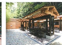
バーベキューガーデン(季節営業)