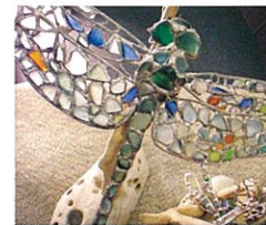
体験教室「アトリエ大自然の恵み」