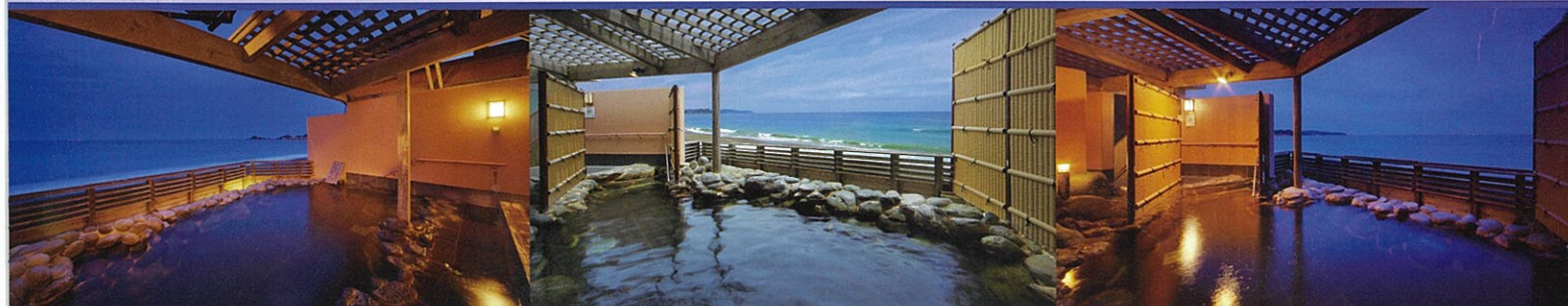
貸切露天風呂「海の湯」

海が聞こえる、波が香る。 南房総のぬくもりに身をゆだねれば、 ここまで洗われ、癒され、ほどかれていく…。 海の彼方に想いをはせて、 湯の時を心ゆくまで。