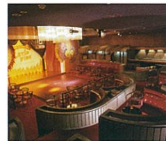
ナイトスポット「チャオ」