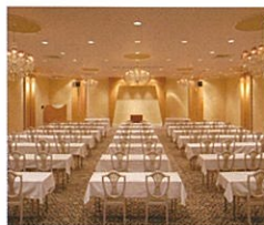
コンベンションホール「白妙の間」