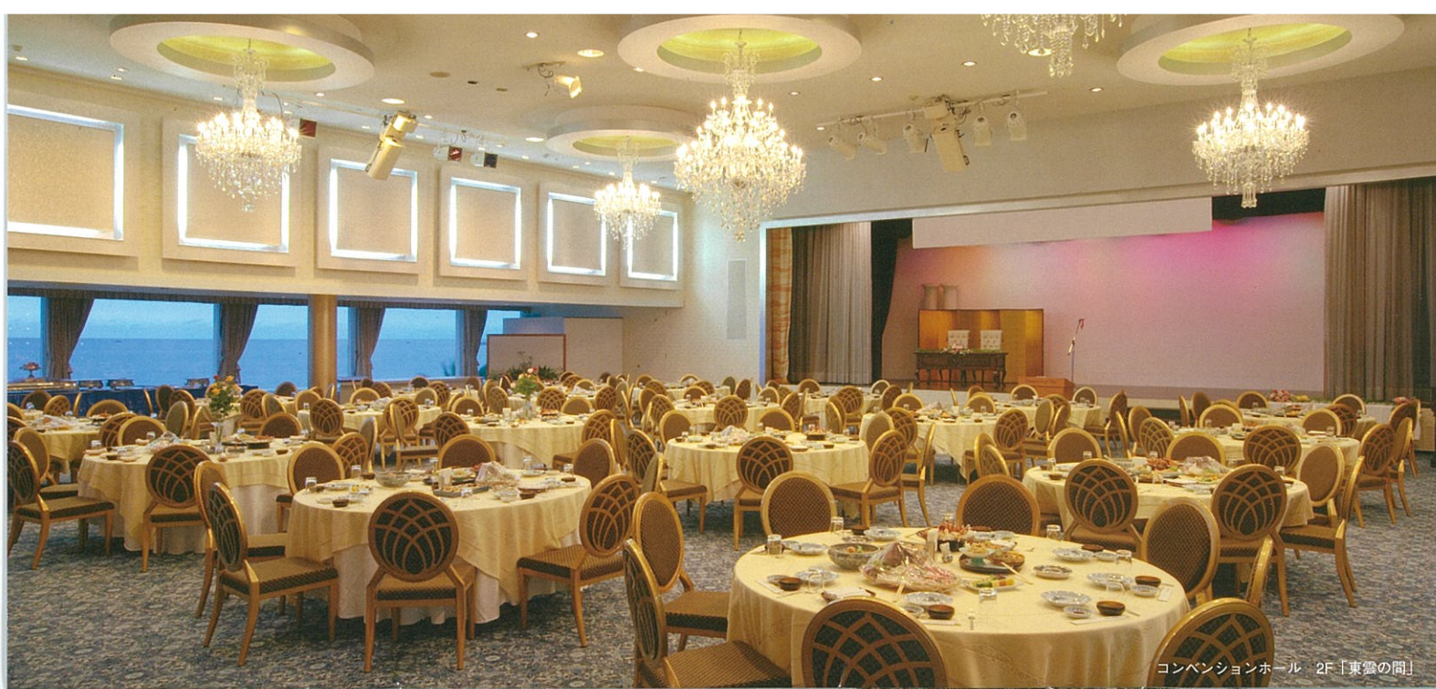
コンベンションホール 2F「東雲の間」