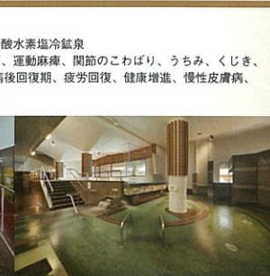
温泉大浴場「内湯」光明石風呂