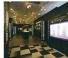
俳人 鈴木真砂女ミュージアム (入場無料)