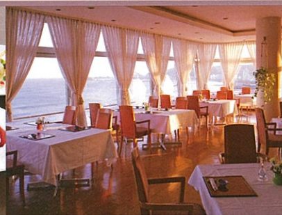
スカイレストラン「卯波」