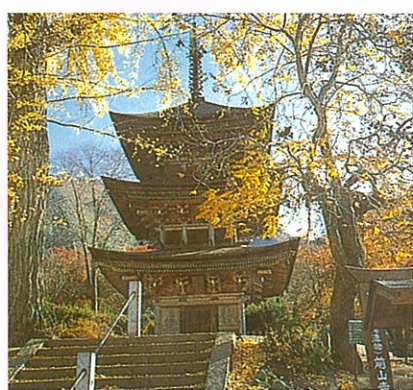
■前山寺重要文化財三重塔