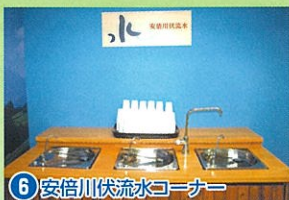
6 安倍川伏流水コーナー