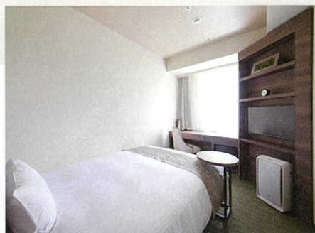
シングルルーム Single room