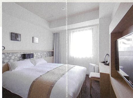
ダブルルーム Double room