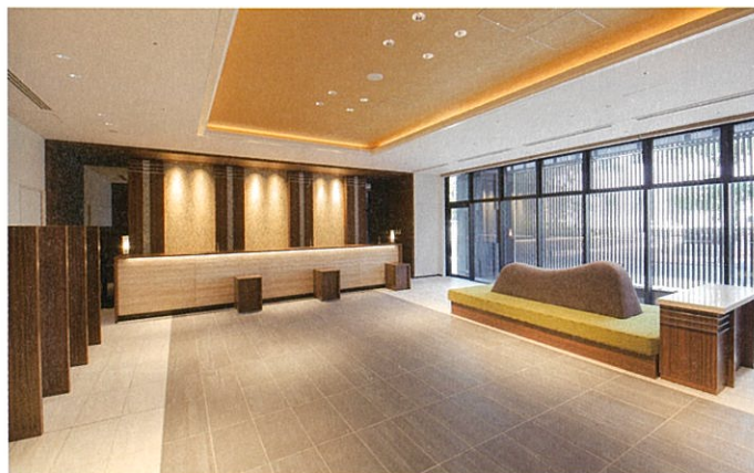
ロビー(フロント) Lobby (Front)