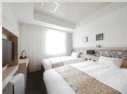
スタジオツインルーム Studio twin room