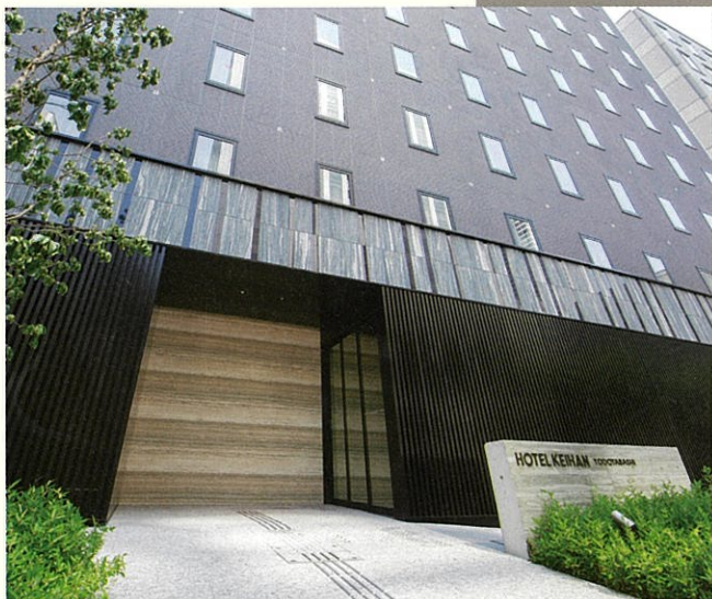
ホテル京阪 淀屋橋 エントランス Hotel Keihan YODOYABASHI appearance