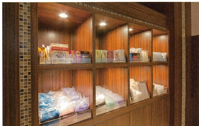
アメニティバー Amenity bar (※アメニティの内容は、時期によって異なります。 The lineup may be changed.)