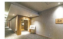
温泉ゆあがり通り