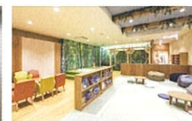
森の音(リラックスエリア)