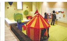
しとなる処(キッズスペース)