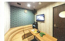
くぜり処(カラオケルーム)