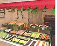
たてしなお菓子工房