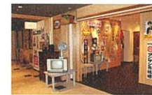
駄菓子屋「だもんで」