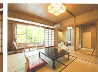
和室 次の間10畳+6畳+書院