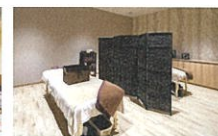
いやしの森(ホディケアルーム)