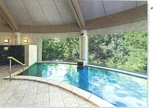
日和の湯 こもれば湯