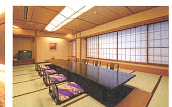
お食事処「せせらぎ亭」