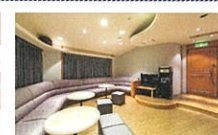
カラオケサロンの美(定員30名様)