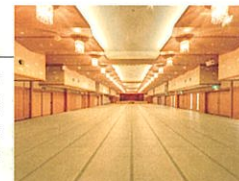
大宴会場「辛夷(こぶし)」

ご宴席やお祝いのお 食事会まで、大小さま ざまな、華やかな宴会 場をご用意してお待 ちしております。