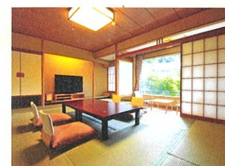
特別室 青山(せいざん)12.5畳+書院