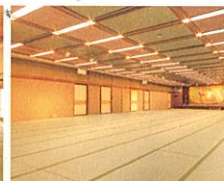
宴会場「瑞風(ずいほう)」