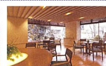
カフェラウンジ「やまのね」