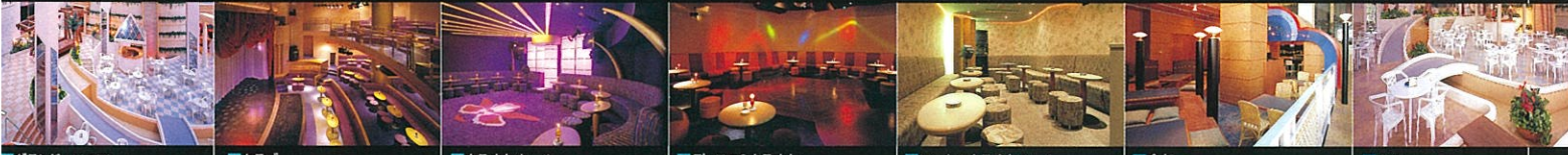
■グランド・フロア「イズ・バラッツォ」 ■クラブ「ムーンライト・ベイ」 ■カラオケホール「オーキッド」 ■ディスコ&カラオケ「ドーガ・ドーガ」 ■レンタルカラオケルーム「ホップ・ステップ・ジャンプ」 ■食処「なぶら亭」 ■カフェ「ポルト・ポルト」