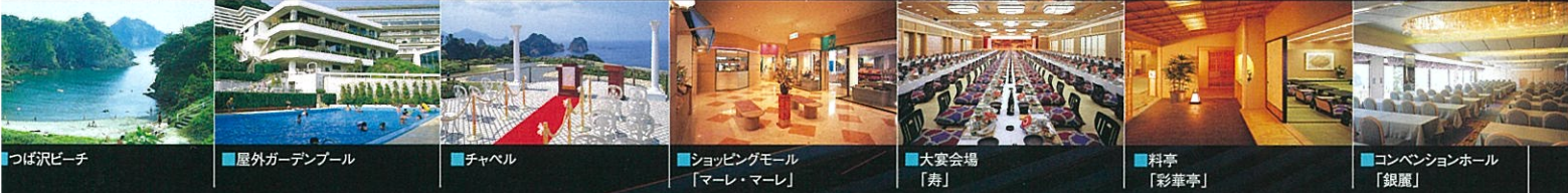
つば沢ビーチ ■屋外ガーデンプール ■チャペル ■ショッピングモール「マーレ・マーレ」 ■大宴会場「寿」 ■料亭「彩華亭」 ■コンベンションホール「銀麗」