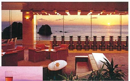
■サンセットサービス (10月中旬～3月上旬) ロビーにてワインサービス ※天候により中止となる場合がございます