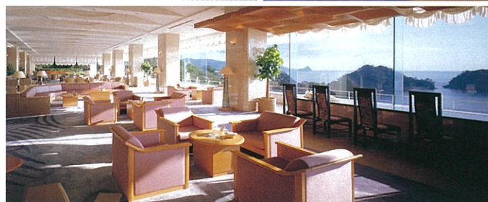
ロビーラウンジ「オンディーナ」