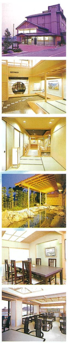
犬山橋から「みづのを」犬山城を望む。

「みづのを」は、水の流れを表す古き言葉。万代の木曾川の流に重なり、ゆったりと時が流れるおもてなしを大切にしております。