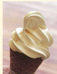
「なると金時ソフト」