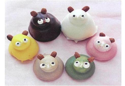
「たぬきケーキファミリー」の人気者 お父さんたぬき(茶)を作っていただけます。