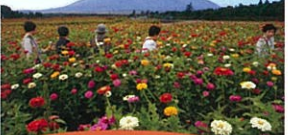
おすすめ観光コース