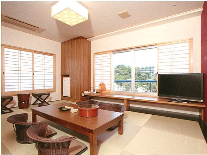
デザイナーズルーム