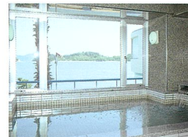
展望大浴場よりエンジェルロードを望む