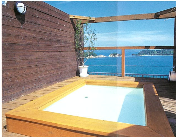
露天風呂(望みの湯)

ほんのり湯気の向こうには 行き交う船と 美しい風景を眺めながら 体の芯が温まるまで、 今日一日の旅の思い出を じっくりと振りかえる。