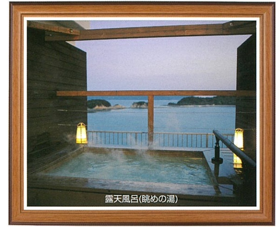
露天風呂(眺めの湯)