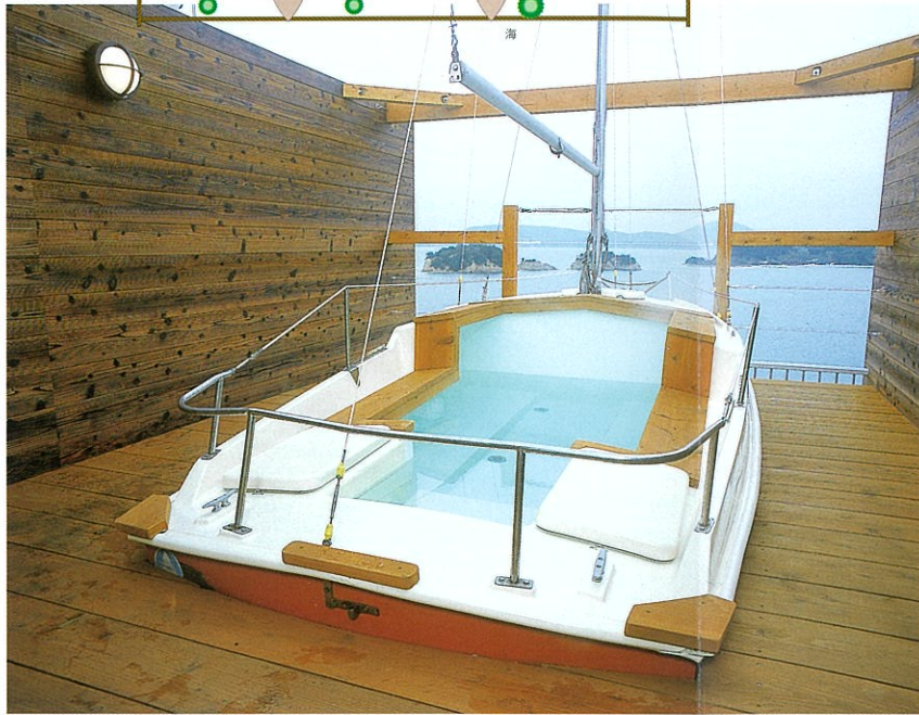
ヨット露天風呂(白帆の湯)