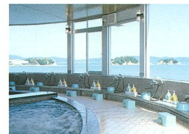
円型展望大浴場よりエンジェルロードを望む