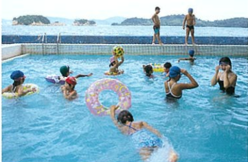
シーサイドプール