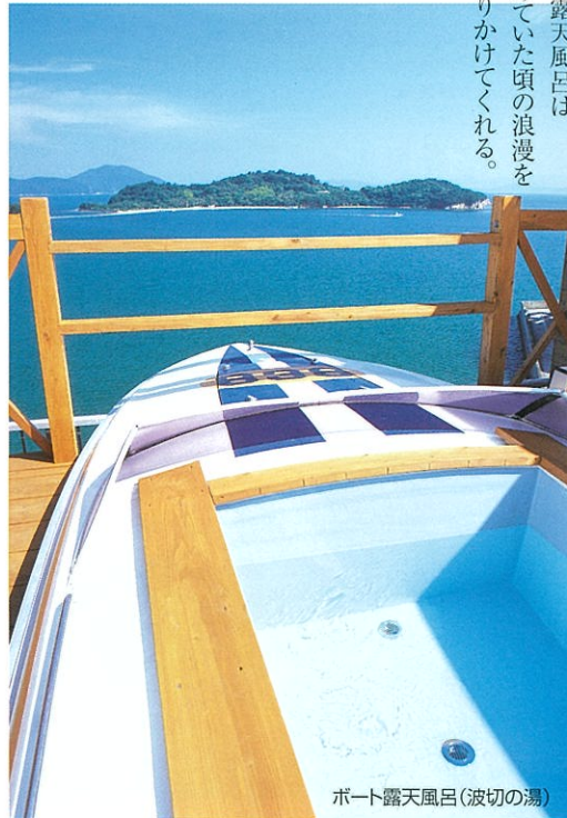
ボート露天風呂(波切の湯)

季節を肌で感じながら くつろぐ露天風呂は 忘れていた頃の浪漫を そと語りかけてくれる。