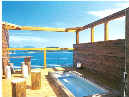
貸切露天風呂(ひしおの湯)