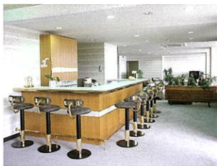
コーヒーコーナー

和室宴会場に テーブルと椅子席を ご用意させていただきます。 立ったり座ったりするのが とてもラクになり、 ゆつたりとお食事を 楽しんでいただけます。 特に女性の方や正座の苦手な方、 ご年配の方々にお薦めできます。