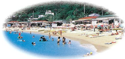
ホテルより徒歩約1分「鹿島ビーチ」

※料金体系は幅がありますので、お客様のご要望に柔軟に対応できます。また、合宿、修学旅行のオーダーにも応じております。