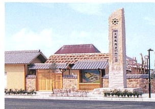
5 大坂城残石記念公園