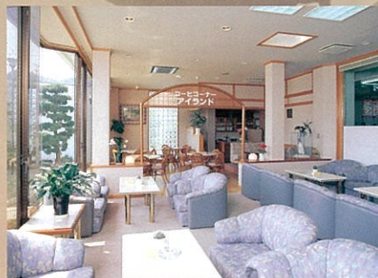
コーヒーコーナー