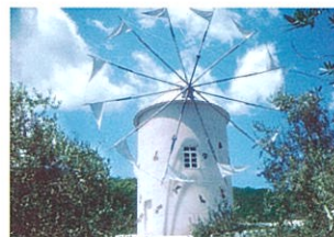
9 小豆島オリーブ公園