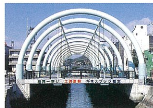
1 土洲海峡(とぶちかいぎょう)