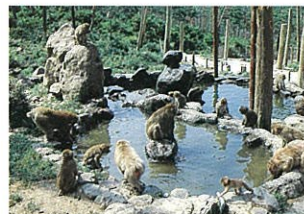
6 銚子溪お猿の国(ちょうしけい)