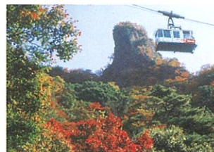
7 寒霞溪(かんかかけい)