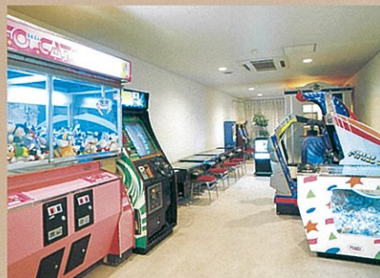
ゲーム・カラオケ・自動販売機コーナー