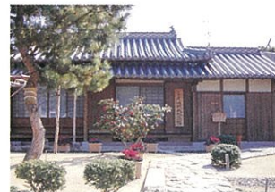
2 尾崎放哉記念館(おざきほうさい)