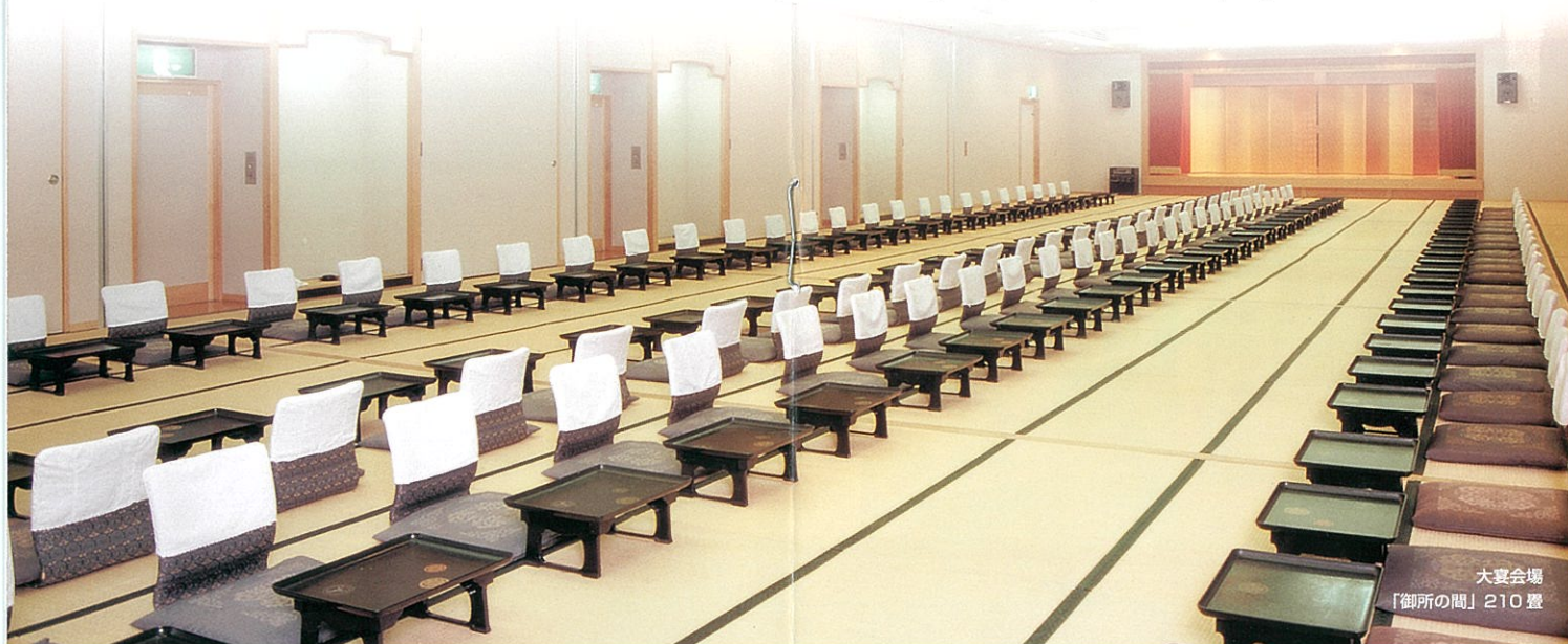
大宴会場 「御所の間」210 畳