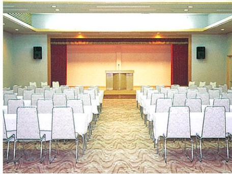
コンベンションホール