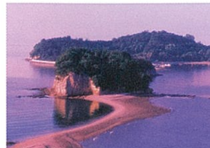
3 エンジェルロード