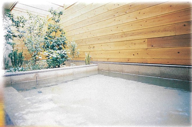
露天風呂「大師の湯」