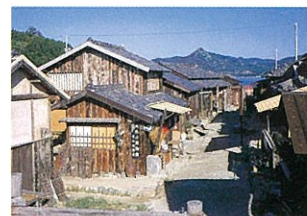
8 二十四の瞳映画村